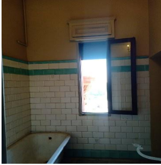
حمامات الطابق الأول بقصر البارون